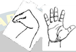
Imagen 4. Señal de mano para amonestación por estar hablando.

En caso de que un golpe aturda al oponente, el juez central deberá detener el tiempo y preguntar a los jueces lo que vieron, si la mayoría decide que es una “falta”, entonces el juez central penalizará al infractor; si se decide que fue un accidente no habrá penalización.