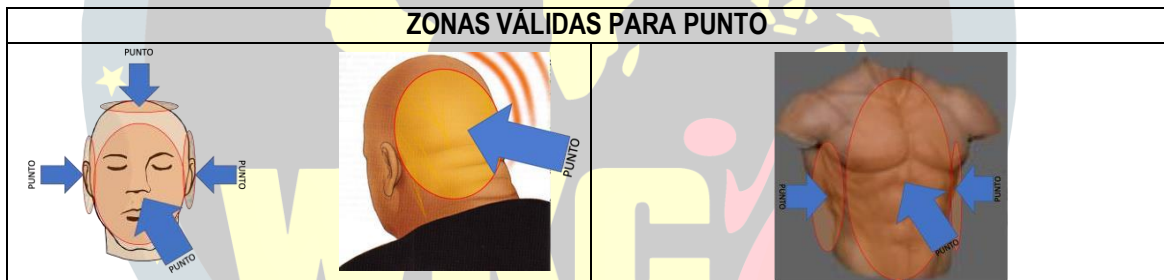
Tabla 2. Zonas válidas de punto en Combate a Puntos.

Las barridas están permitidas y además cuenta como un punto si causan desequilibrio y deberán ser a la pantorrilla.