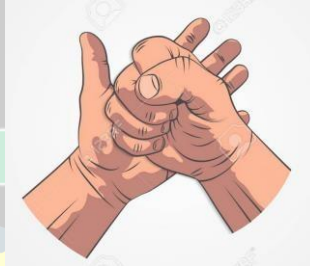
Imagen 3. Señal de mano para exceso de contacto.