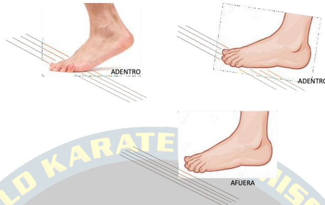
Imagen 1. Criterios de pisado fuera o dentro del área de combate.

Regla de Salida: Es cuando al menos un pie completo está afuera del área de competencia. En caso de salida de uno de los competidores, el competidor que ataca debe permanecer dentro del área para que cuente el punto.