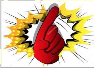
Imagen 2. Señal de mano para amonestación.