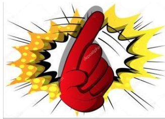
Imagen 2. Señal de mano para amonestación.

está siendo amonestado; entonces el réferi mostrará a éste, a través de la señal de mano, "latiguar" (flagelar, agitar violentamente) el dedo y decir: "NO".