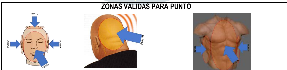
Tabla 6. Zonas válidas de punto en Light Contact (Combate Continuo).