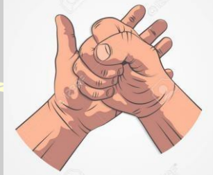
Imagen 3. Señal de mano para exceso de contacto.